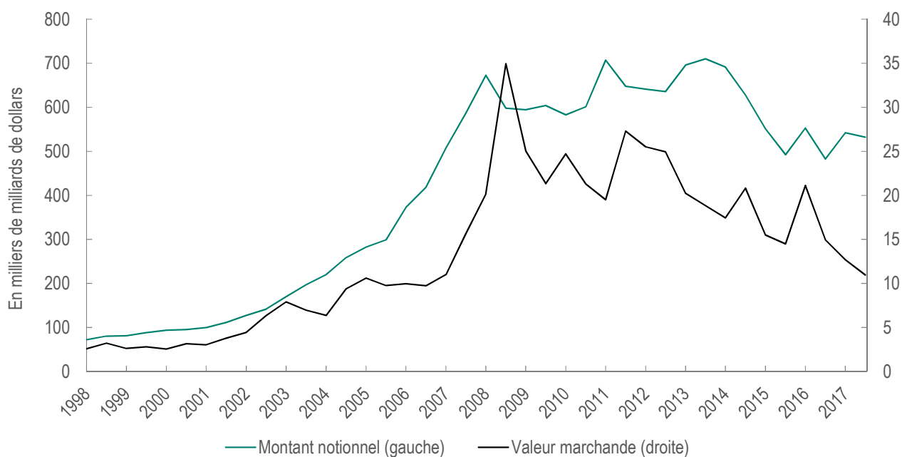
Graphique 2 – Évolution des montants notionnels et de la valeur marchande brute sur le marché des produits dérivés