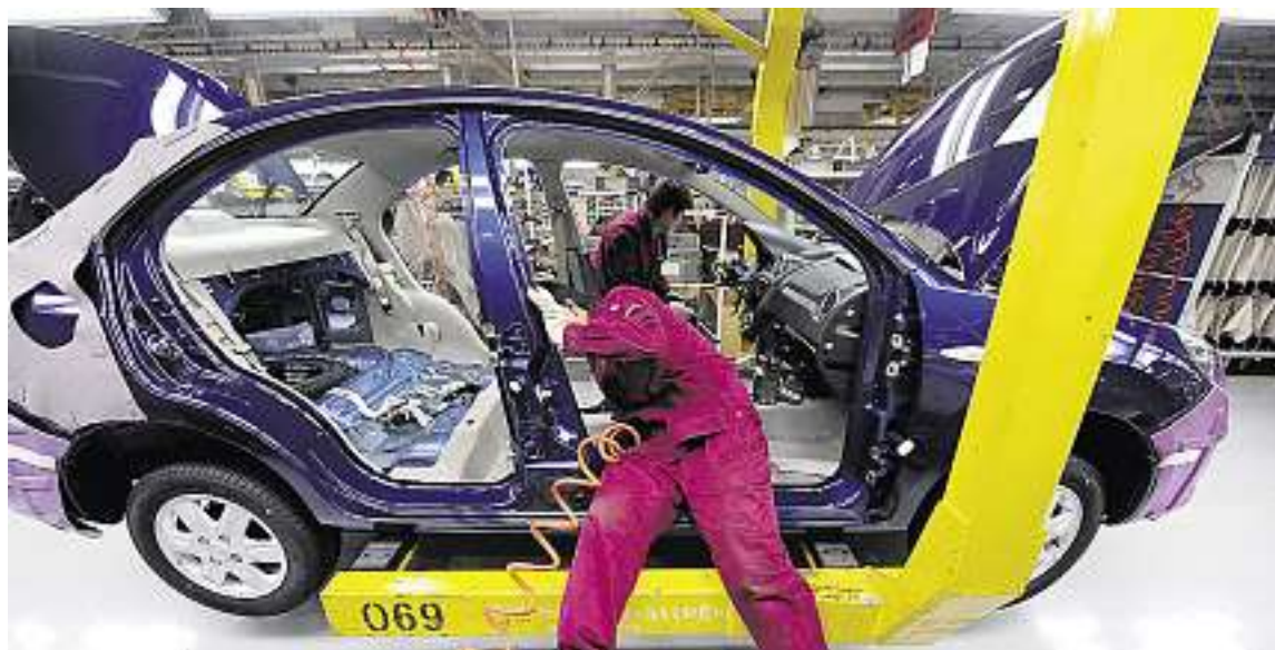
La Chine et l'Inde ont manifestement des ambitions dans le secteur automobile, comme en témoignent le rachat des marques Jaguar et Land Rover par un groupe indien en 2008 et celui de Rover en 2007 et de Volvo par des entreprises chinoises en 2009.

À terme, l'expansion internationale des firmes indiennes et chinoises va les mettre en concurrence. Elles le sont déjà pour l'accès aux ressources minérales, qui fait partie de leurs objectifs stratégiques. Le rachat des marques Jaguar et Land Rover par un groupe indien en 2008 et celui de Rover en 2007 et de Volvo en 2009 par des entreprises chinoises témoignent des ambitions des deux pays dans le secteur automobile.