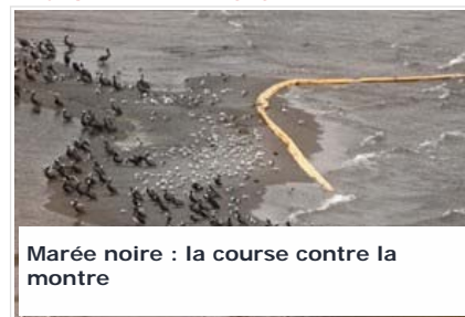
Marée noire : la course contre la montre