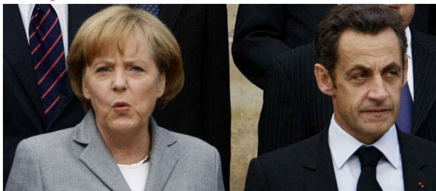
L'Allemagne et la France ont opté pour le déblocage de prêts à la Grèce à un taux de 5 % dans l'espoir d'éviter toute renégociation de la dette grecque avec ses créanciers

La Grèce est-elle tirée d'affaire ? Dimanche, les ministres des Finances de la zone euro ont entériné, après plusieurs semaines de tergiversations, leur plan d'aide à Athènes en coopération avec le FMI . Cent dix milliards d'euros seront mis sur la table sur trois ans, dont quarante-cinq milliards dès 2010. Cette somme devrait permettre au pays de faire face à ses échéances, la principale étant attendue le 19 mai. Mais de nombreux économistes restent sceptiques quant à la réussite de ce plan, qui doit s'accompagner d'une phase de rigueur sans précédent dans la zone euro. Ils anticipent une restructuration de la dette grecque (rééchelonnement, voire décote sur les remboursements), seule solution susceptible, selon eux, de briser la spirale de l'endettement du pays.